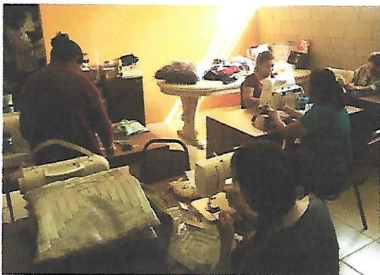
Sala de Costura