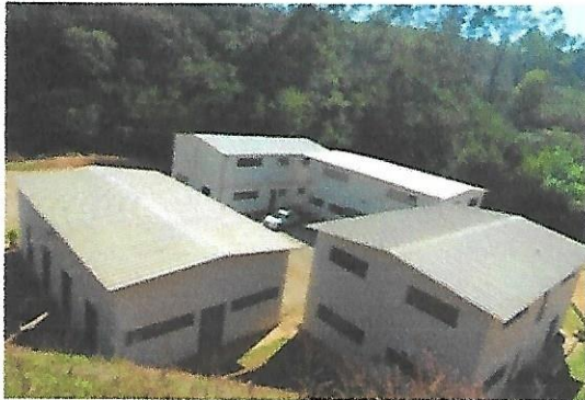
Conjunto de prédios da sede