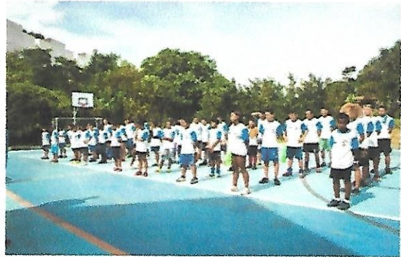
Quadra poli esportiva