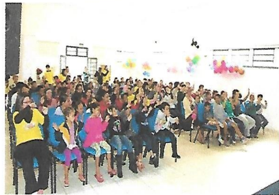
Salao de Eventos