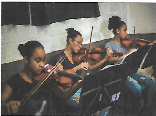
Sala de Música